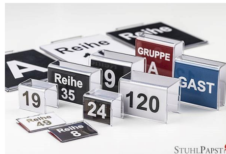
Reihennummerierung zum Aufkleben